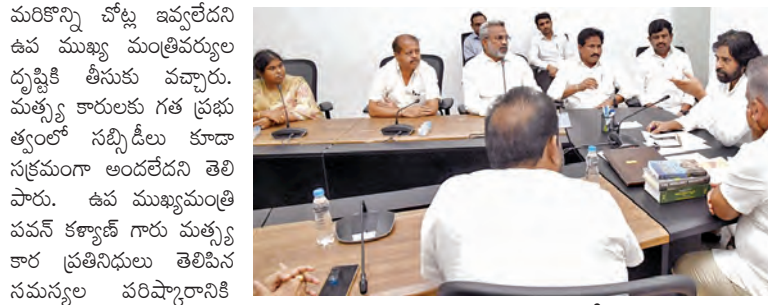
ఉప ముఖ్యమంత్రి క్యాంపు కార్యాలయంలో మత్స్యకార ప్రతినిధులు, ప్రజా ప్రతినిధులతో పవన్ కల్యాణ్