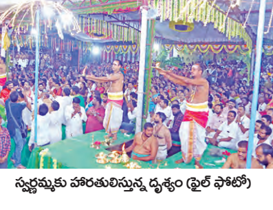
స్వర్ణముఖి హారతులను దృశ్యం