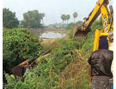
వలస కూలీలతో వెళ్తున్న ట్రాక్టర్ బోల్తా - కూలీ మృతి.. 8 మందికి గాయాలు